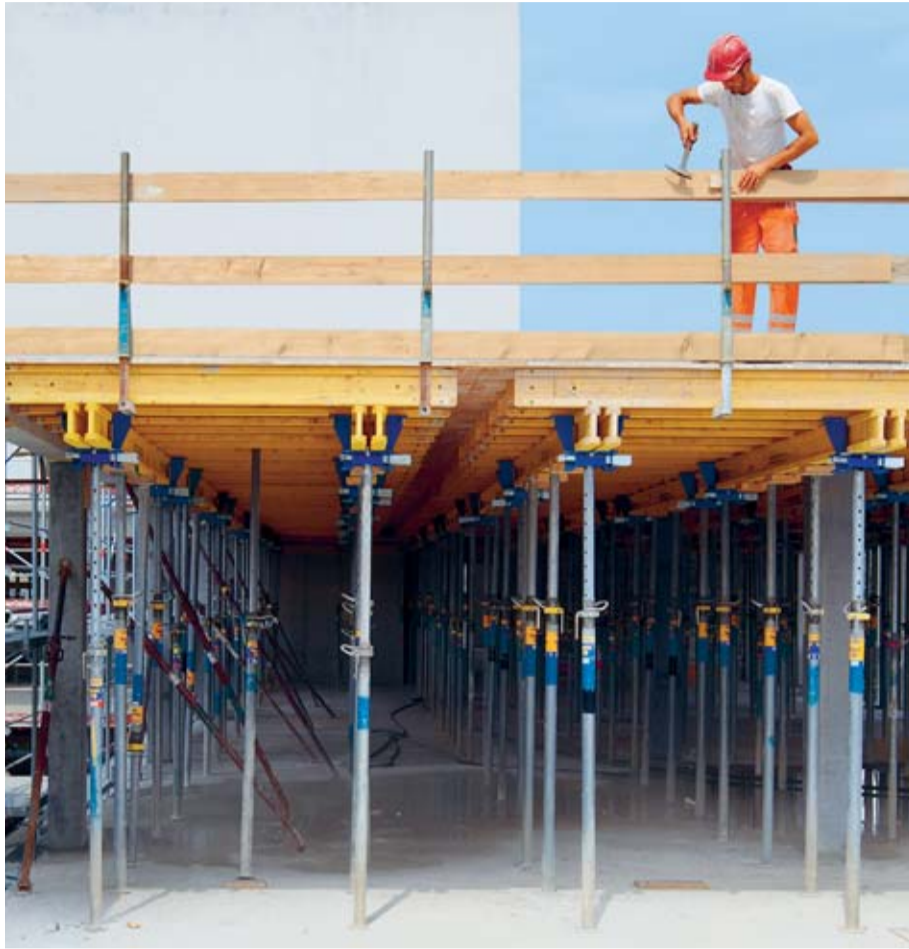
Regel 1: Wir sichern Absturzkanten ab einer Absturzhöhe von 2 m.