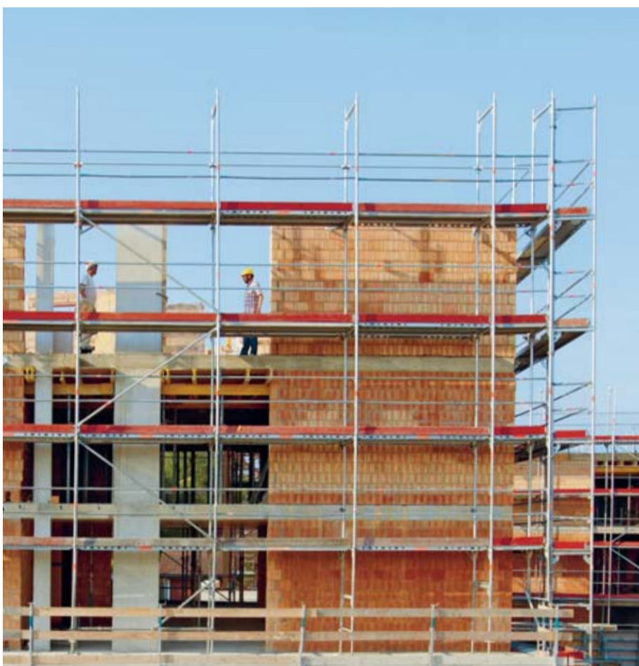
Regel 4: Wir erstellen das Fassadengerüst ab einer Absturzhöhe von 3 m.