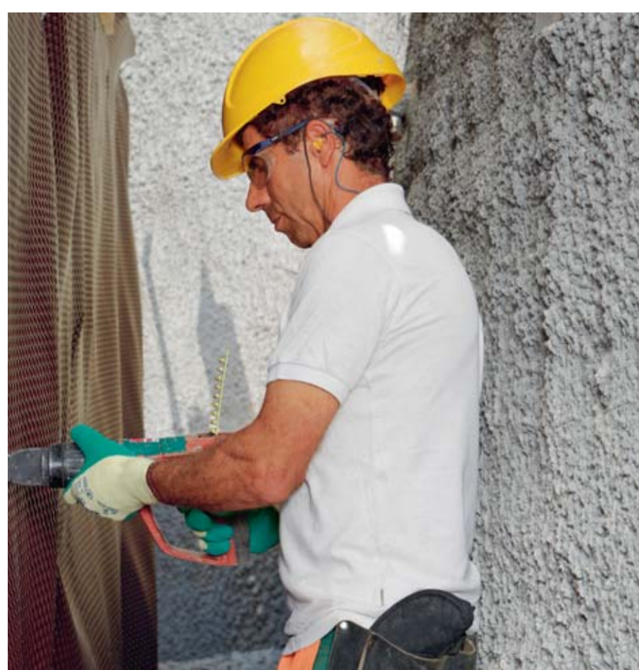
Regel 8: Wir sichern Gräben und Baugruben ab einer Tiefe von 1,5 m.