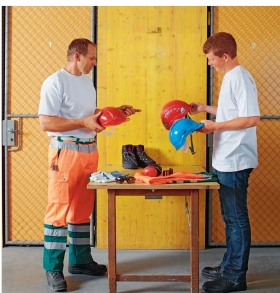
Regel 7: Wir tragen die persönliche Schutzausrüstung.