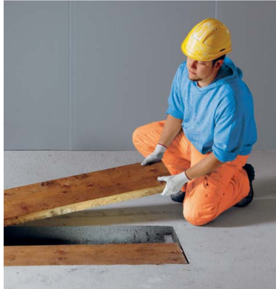
Regel 2: Wir sichern Bodenöffnungen sofort.