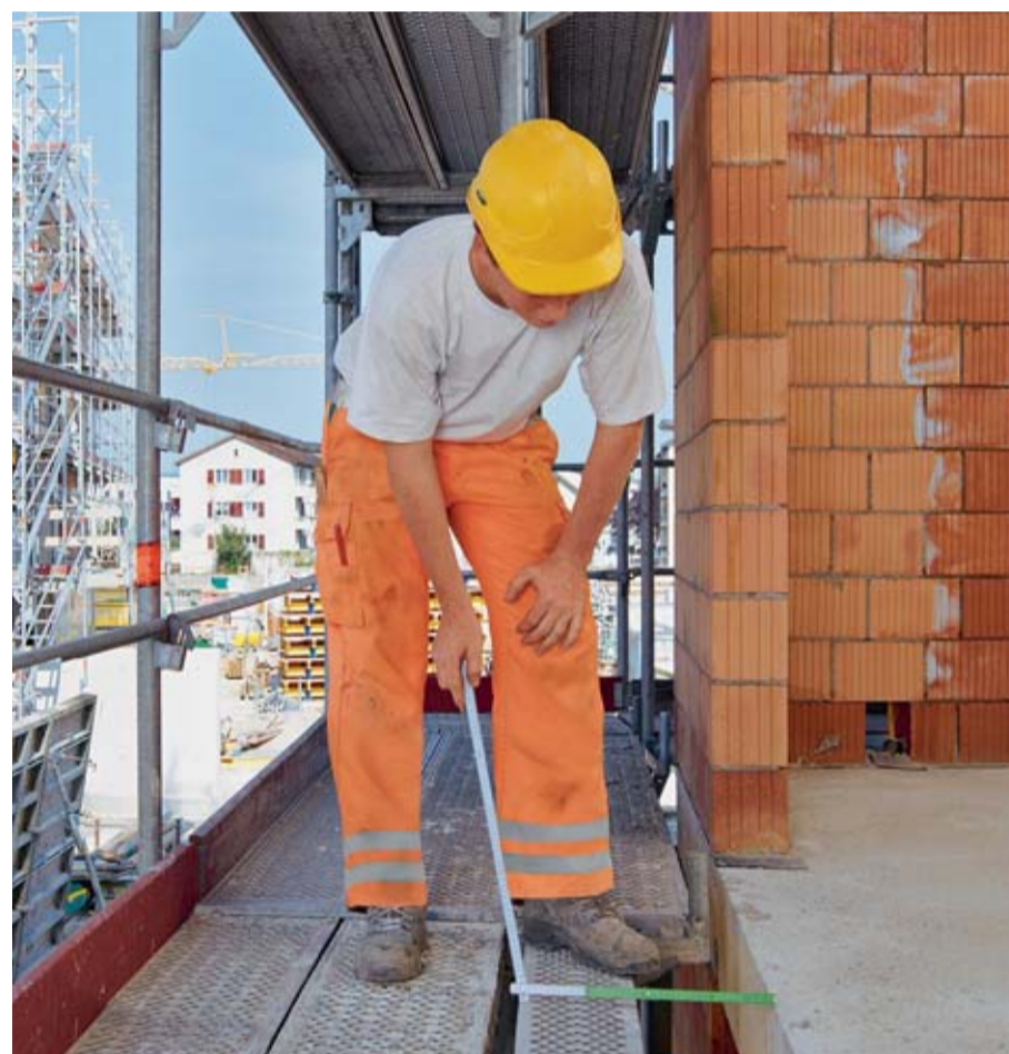
Regel 5: Wir kontrollieren die Gerüste täglich.